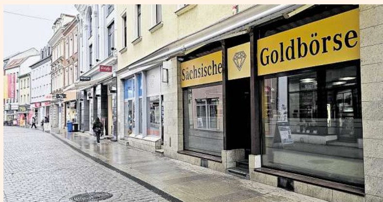
im ehemaligen Reiseland, gegenüber Ctronics & Viba-Sweets Bitte achten Sie auf unser Firmenlogo mit dem Diamanten!