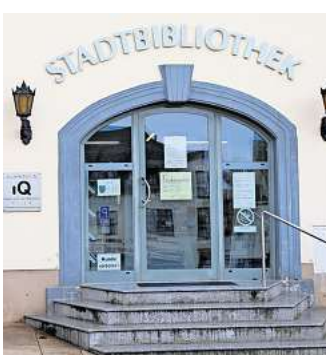
IN DER STADTBIBLIOTHEK SCHMÖLLN kann man aktuell 16 Scherenschnitte sehen.

Genau diese große Auswahl an Liedtexten war auf Initiative des Heinrich-Schütz-Hauses Bad Köstritz für eine dortige Ausstellung im Jahr 2024 Inspiration für den