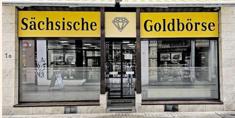
Bitte beachten Sie die beiden Kundenstopper vorm Geschäft!

Wann haben Sie das letzte Mal die Zeit genutzt, um zu Hause auszusortieren? Auch bei Ihnen im heimischen Haushalt lohnt es sich, einmal genauer hinzuschauen. Hier werden