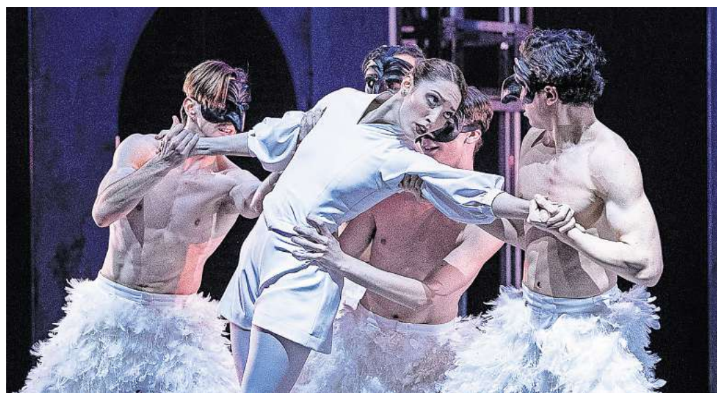
BEIM BALLETT-DOPPELABEND dreht sich alles um die Musik von Igor Strawinsky.

Diese Choreografie gilt heute als Rarität auf den Spielplänen. Umso besonderer ist es, dass das Thüringer Staatsballett dieses Werk nun in der Original-Choreografie von John Cranko auf die Bühne bringt. Einen spannenden Kontrast dazu bildet „Pulcinella“. Das Ballett entstand aus der Begeisterung des Impresarios Sergej Diaghilew für die Commedia dell'arte. Er beauftragte Igor Strawinsky mit der Komposition, die 1920 in Paris in einer Ausstattung von Pablo Picasso uraufgeführt wurde. In einer Neufassung entwickelten der Choreograf Arshak Ghalumyan und sein