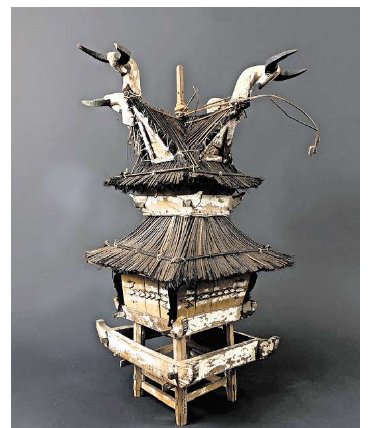
MODELL EINES SCHÄDELHAUSES aus Sumatra (Indonesien) aus der ethnografischen Sammlung des Mauritiums Altenburg.

Mit den Einblicken in die Sammlung, zeigt die Provenienzforscherin auch, wie Akteure aus Altenburg in ehemaligen Kolonien tätig waren und welche Spuren des Kolonialismus heute noch in Altenburg zu finden sind.