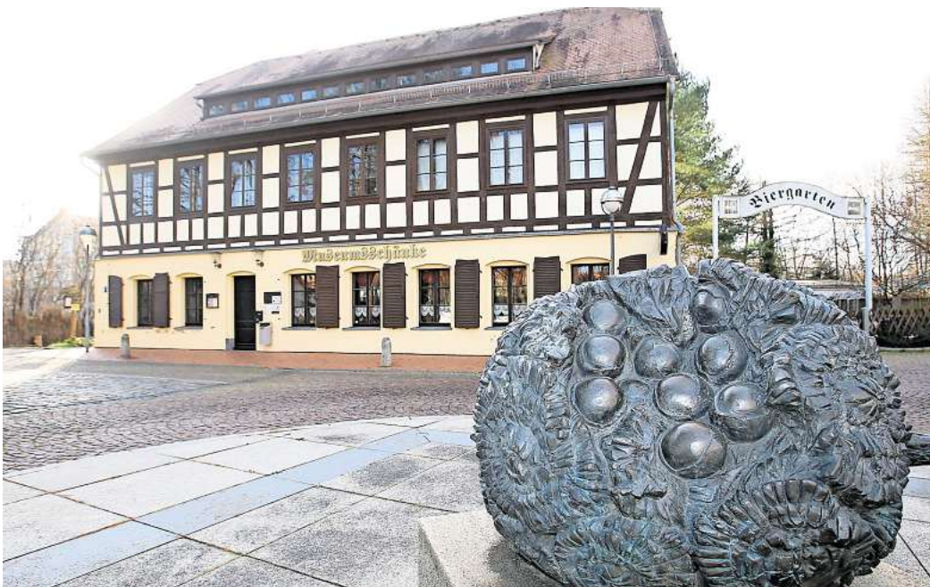
IM KNOPFMUSEUM SCHMÖLLN gibt es im Mai gleich mehrere Aktionen zu erleben.

Das Angebot richtet sich sowohl an Einsteigerinnen und Einsteiger als auch an alle, die ihre Kenntnisse auffrischen möchten. Am Samstag, dem 17. Mai, beteiligt sich das Museum am Internationaler Museums- tag. Aus diesem Anlass gelten erweiterte Öffnungszeiten von 11 bis 17 Uhr. Besucherinnen und Besucher haben die Möglichkeit, an kostenfreien Führungen teilzu-