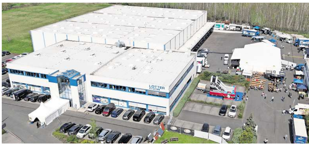
Lotter Metall lädt am 9. und 10. Mai zur Hausmesse.

Erinnert sich noch jemand an die Schlagzeilen von 2023? „Habeck will uns das Heizen mit Gas und Öl verbieten“ – so oder ähnlich klang es damals in vielen Medien. Drei Jahre später ist die Debatte zurück. Die heutige Bundesregierung war angetrieben, das Heizungsgesetz wieder abzuschaffen. Herausgekommen ist ein Kompromiss mit