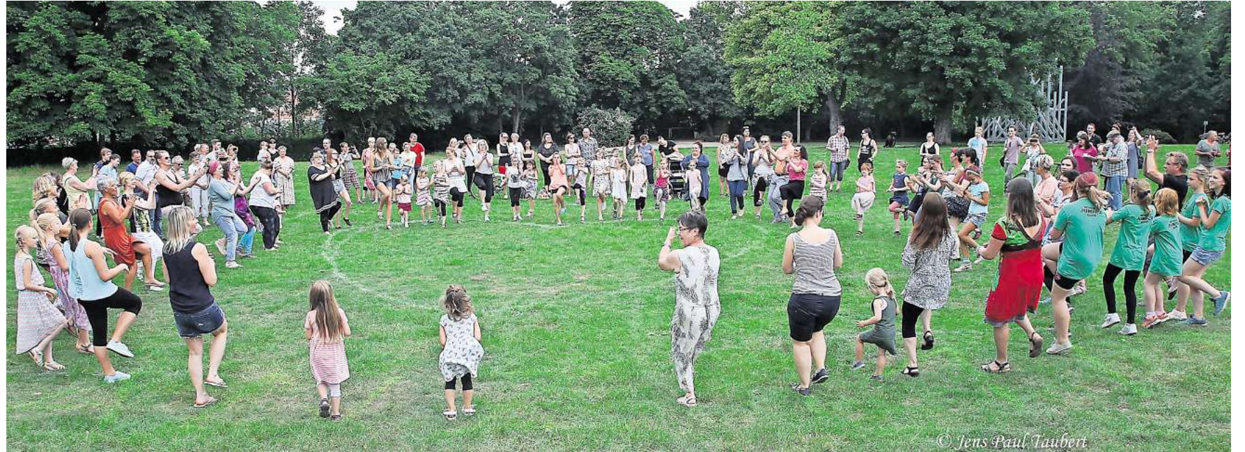
AM 10. MAI wird auf der Teehauswiese in Altenburg wieder getanzt.

TANZ-EVENT ZUM WELTTANZTAG und Muttertag am 10. Mai in Altenburg