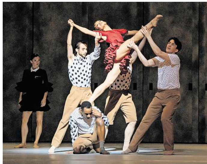
Das Aalto Ballett Essen gastiert beim Internationales Ballettfestival Gera26 mit „Carmen“.

gung im Nationalsozialismus. Die Inszenierung zeigt außerdem den Aufbruch in die Tanz-Moderne. Mit Sasha Waltz & Guests ist eine der international bedeutendsten Compagnien des zeitgenössischen Tanzes in Gera zu erleben. Ihre Produktion „In C“ steht für einen offenen, experimentellen künstlerischen Prozess.