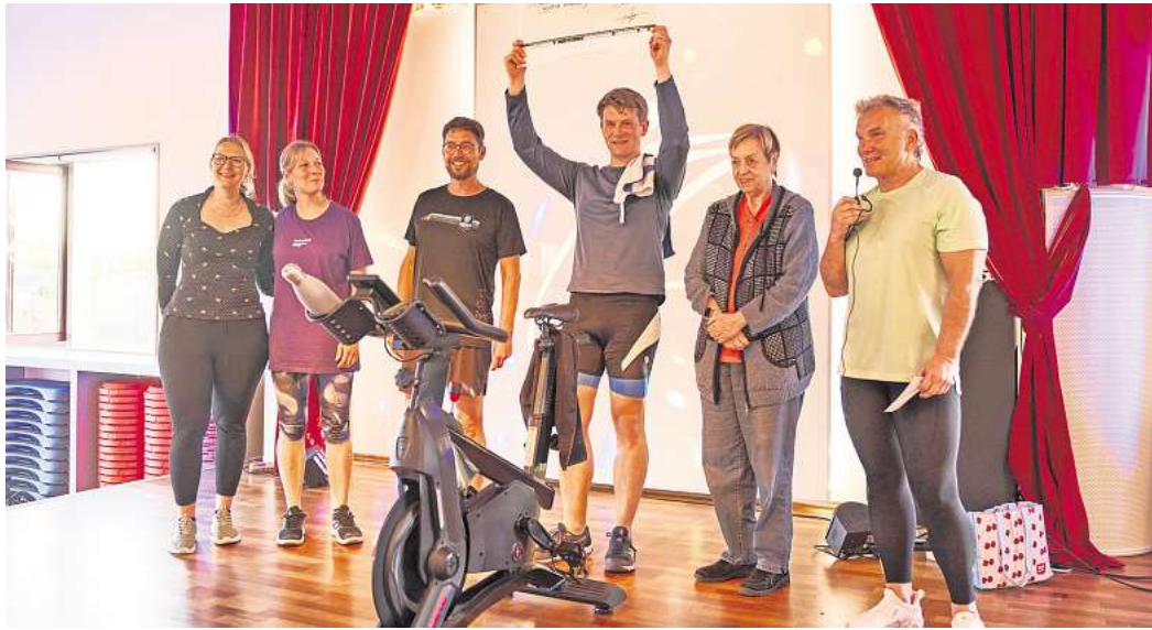
Wieder sehr erfolgreich: Beim Benefizradeln in der Alten Ziegelei kamen diesmal fast 18.000 Euro für das Hospiz Altenburg zusammen.

Etwa 380 Sportlerinnen und Sportler erradelten im Fitnessstudio „ALTE ZIEGELEI“ knapp 18.000 Euro für das Hospiz Altenburg