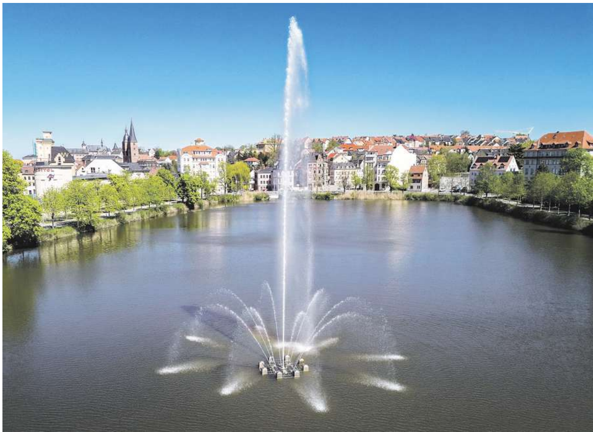
Blickfang und beliebtes Fotomotiv: die stolze Fontäne im Großen Teich.

Die Fontäne, Blickfang im Großen Teich, leuchtet in der kommenden Woche, beginnend am 12. Mai, mit Einbruch der Dunkelheit in einem augenfälligen Blauton. Die Aktion hat einen ernsten Hintergrund. Die Stadt beteiligt sich damit nach 2024 und 2025 zum dritten Mal am „Internationalen ME/CFS-Tag“ der Initiative „LightUpTheNight4ME“. Das Kürzel ME/CFS steht für Myalgische Enzephalomyelitis/Chronisches Fatigue Syndrom. Das ist eine schwere, derzeit unheilbare, neuroimmunologische Multisystemerkrankung, die häufig durch eine Virusinfektion, etwa nach einer EBV-Infektion, Covid-19 oder nach der Influenza entsteht.