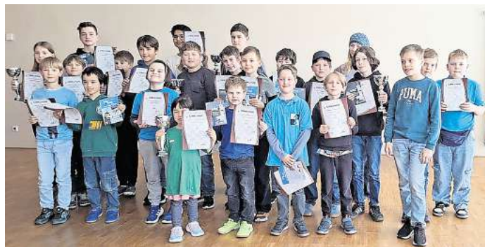
Im Rahmen der Internationalen Altenburger Schachtage fand auch ein eigenes U14-Jugendturnier statt.

Das Turnier funktionierte sportlich und organisatorisch – und ließ zugleich erkennen, welches Potenzial dieses Format für Altenburg hat. Möglich wurde die Premiere nur durch die Unterstützung zahlreicher Partner und Förderer. Der Dank des Veranstalters gilt insbesondere der Stadt Altenburg, der Sparkasse Altenburger Land, ChessBase, chess4u, bagelbakery.de sowie dem Team des Goldenen Pflugs. Nach dieser gelungenen ersten Auflage spricht vieles dafür, dass die Altenburger Schachtage nicht zum letzten Mal stattgefunden haben.