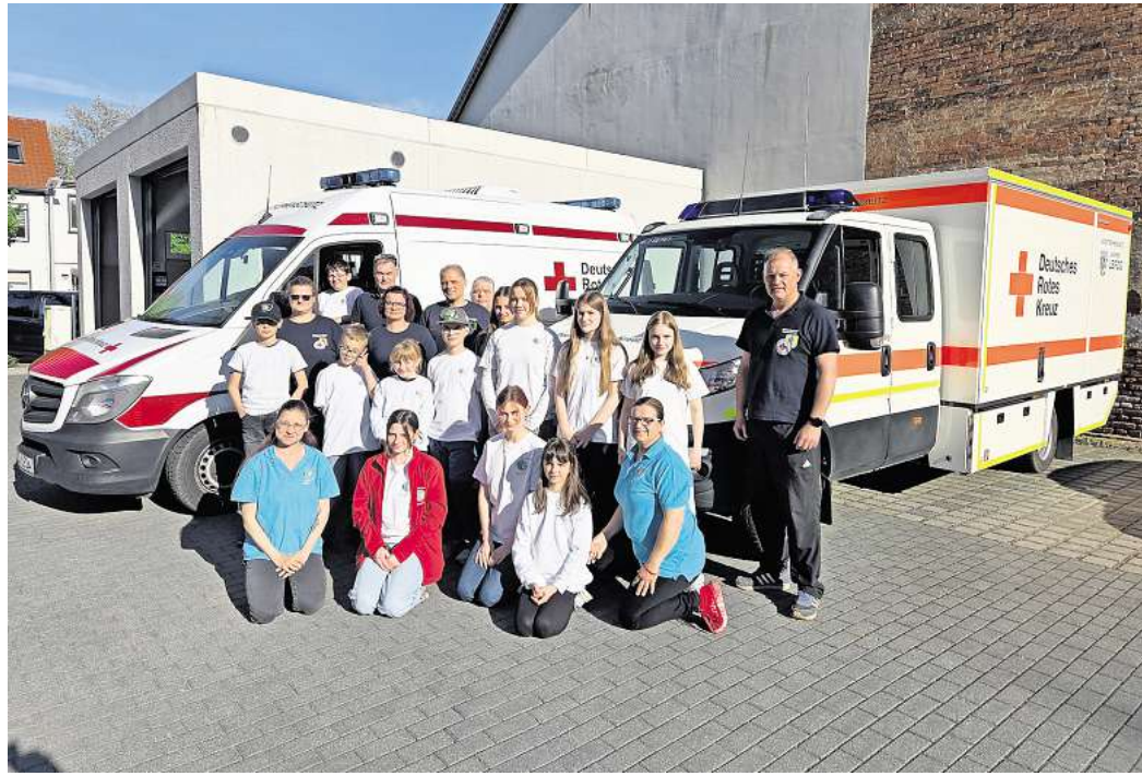
Lädt am 14. Juni zur Jubiläumsfeier auf den Marktplatz: Der Ortsverband Markranstädt vom Deutschen Roten Kreuz.

DRK-Ortsgruppe Markranstädt lädt dazu am 14. JUNI ein