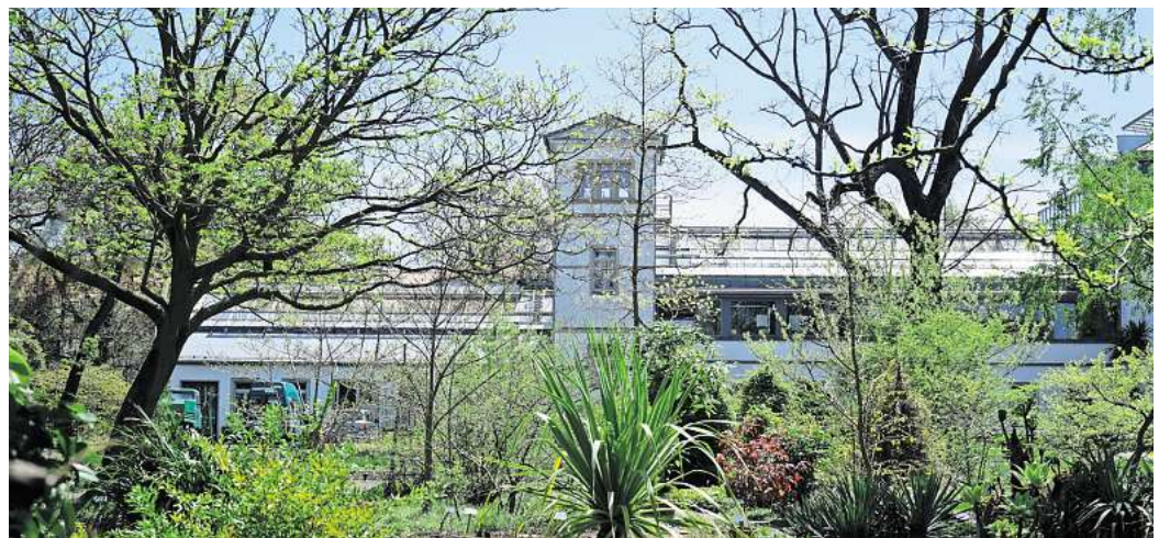
Wie geht eigentlich die „Wilde Vielfalt im Garten“? Das zeigt aktuell der Botanische Garten in Leipzig.

Aber auch ansonsten lohnt sich der Gang in den Botanischen Garten Leipzig: Dort lockt die Ausstellung zur Aktionswoche und die zeigt, wie lebendig Gärten sind – und zwar über die