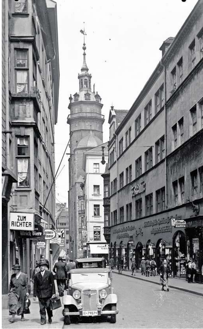
Einen Blick auf sächsische Denkmale öffnet eine neue Ausstellung – wie hier auf den Turm der Nikolaikirche aus dem Jahr 1939.

Zum zweiten ist es aber auch die Präsentation eines wahren Schatzes: Rund 200.000 Aufnahmen von 80.000 großformatigen Glasplatten- und Kunststoffnegativen bis hin zu 50.000 Digital- und aktuellen Drohnenfotografien umfasst die Samm-