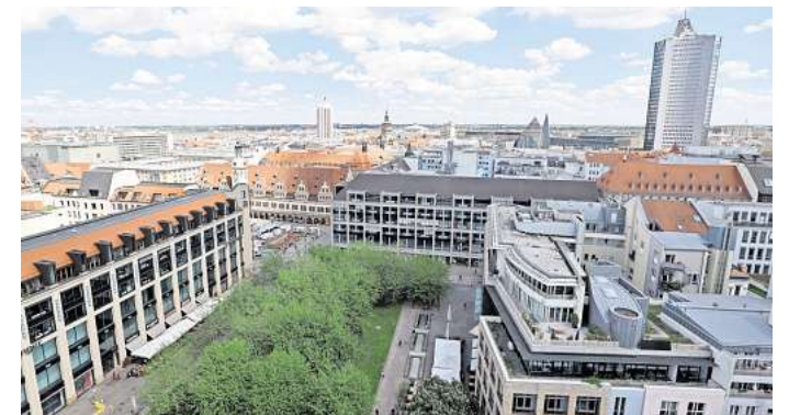
Dieser Blick öffnet sich von der Thomaskirche über Leipzig.