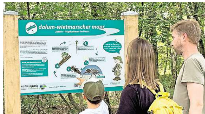
Das Dalum-Wietmarscher-Moor ist ein Teil des Internationalen Naturparks Bourtanger Moor im Grenzgebiet von Niedersachsen und den Niederlanden.

Intensive NATURERLEBNISSE zwischen Harz, Weserbergland und Emsland