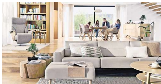
Angekommen im Zuhause: Eine harmonische Einrichtung trägt zum Wohlfühlen bei.

eine Atmosphäre, die zugleich beruhigend und einladend wirkt. Materialien wie das Leder Velaro in „Dark Caramel“ greifen diese Lichtstimmung auf und übersetzen sie in den Wohnraum. Neben Farbe und Material gewinnt auch der Komfort weiter an Bedeutung: Sofas, die sich flexibel anpassen und unterschiedliche Sitz- und Liegepositionen ermöglichen, unterstützen individuelle Bedürfnisse und fördern echte Entspannung. Wie sich Gestaltung und Funktion verbinden lassen, zeigen Hersteller wie Stressless exemplarisch. Informationen zu Materialien, Farben und Gestaltungskonzepten finden sich etwa unter www.stressless.com sowie im Möbelfachhandel. DJD