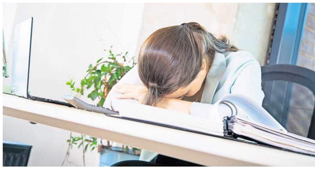
Immer leisten, bis plötzlich nichts mehr geht: Hinter einem Burn-out steckt meist eine Erschöpfungsdepression.

► Erschöpfung: Betroffene schildern, dass ihnen die Energie