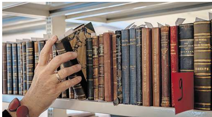
5000 Tauchnitz-Bände sind nun neu im Bestand der Leipziger Universitätsbibliothek.