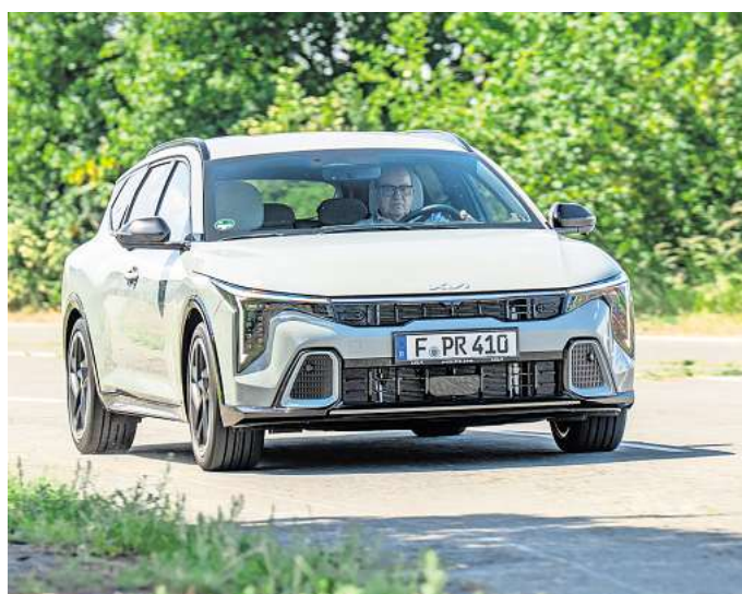
Er belebt das Kombiangebot bei Kia: Der neue K4 Sportswagon.

verfügt über eine breite Basisausstattung inklusive Navigation, Smart-Key, Klimaanlage und Rückfahrkamera. Für Sicherheit sorgen serienmäßig neben sieben Airbags inklusive Mittensairbag vorn, zahlreiche moderne Assistenzsysteme, wie Frontkollisionswarner, adaptive Geschwindigkeitsregelanlage, aktiver Spurhalteassistent und Müdigkeitswarner. Die Preise starten bei 29.890 Euro für den K4 Sportswagon 1.0 T-GDI Core und beinhalten wie bei der Marke üblich die 7-Jahre-Kia-Herstellergarantie. WMD