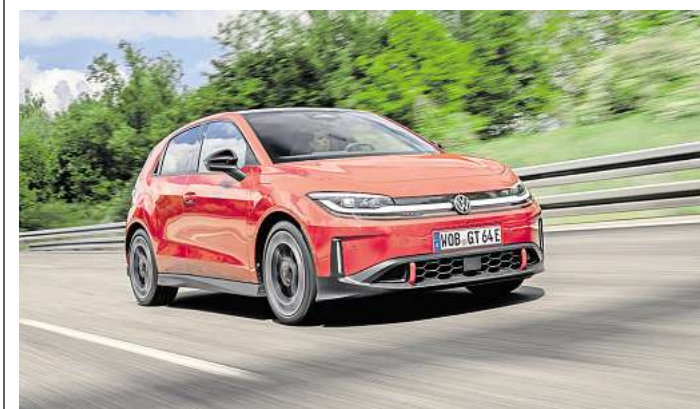
Unterwegs in eine neue Zeit: VW stellt den ID. Polo GTI vor.

Zur Serien-Technikausstattung gehören neben der Vorderachsquerstrebe das adaptive DCC-Sportfahrwerk sowie eine eigens für den GTI entwickelte Progressivlenkung. Die Leistung von 166 kW (226 PS) und das maximale Drehmoment (290 Nm) des ID. Polo GTI stehen permanent zur Verfügung. Für Vortrieb sorgt im ID. Polo GTI das Antriebssystem, das über die NMC-Batterie mit einem Energiegehalt von 52 kWh (netto) mit Strom versorgt wird. Sie ermöglicht eine Reichweite von bis zu 424 km (Hersteller-Angabe) und kann mit bis zu 105 kW an DC-Säulen geladen werden. WMD