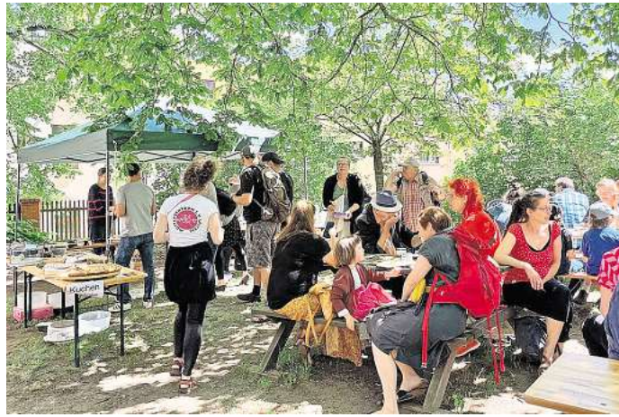
In den Pfarrgarten der Taborkirche wird am 21. Juni geladen: Die Bürgerinitiative Kleinzschocher stellt wieder das Bürgerfest auf die Beine.

Das Bürgerfest beginnt mit unterhaltsamer Musik von Andreas Leopold von der Gitarrenschule Leipzig an der Ukulele, gefolgt von der Akkordeonschule Trenolo, dem Chor der Hochschule für Grafik und Buchkunst, dem Duo Filine & Jonas mit Voice und Piano und der abschließenden Band Lipsi Tight. Währenddessen verzaubert das Papiertheater ZSCHO die Gäste mit zwei Aufführungen für Groß und Klein, der Verein Familien im