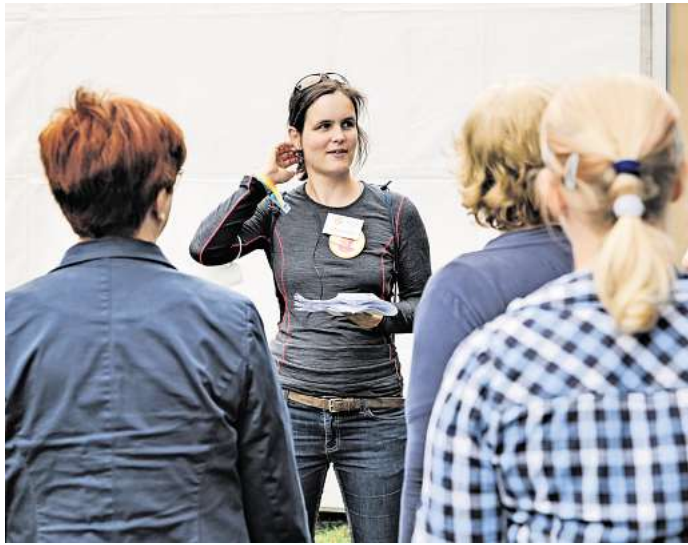
Freiwillige vor! Für das Event chor.com sind noch Menschen gesucht, die sich ehrenamtlich bei Organisation und Durchführung engagieren wollen.

Volunteers für CHOR.COM im Oktober in Leipzig werden aktuell gesucht