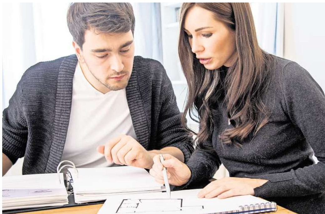
Wissen, was man will: Wer ein Haus baut, sollte sich vor der konkreten Planungsphase Gedanken über die eigenen Wohnbedürfnisse machen.