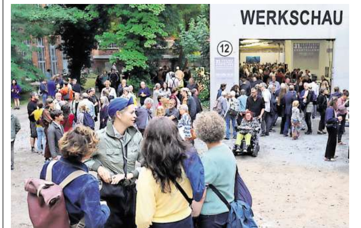
Vorhang auf für die Leipziger Kunst: Ab 18. Juni lockt die Jahresausstellung wieder zu einem Besuch.

Infos: www.leipziger-jahresausstellung.de