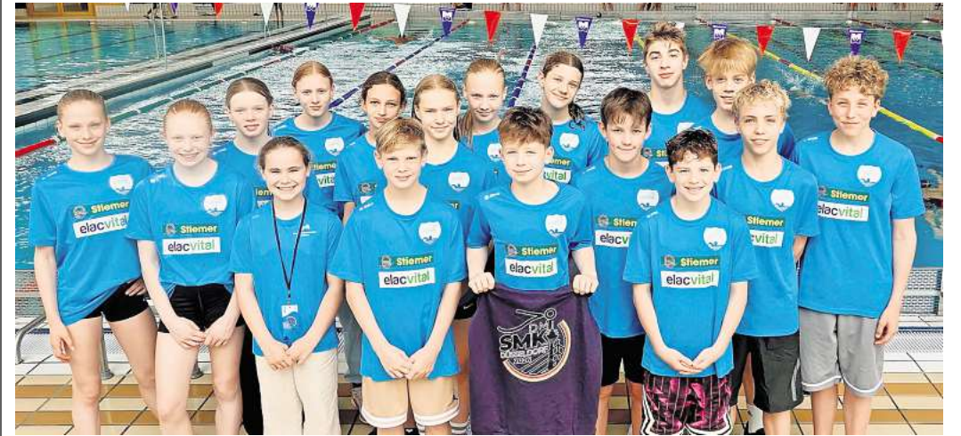
Der Nachwuchs der Schwimm-Startgemeinschaft Leipzig (SSG) räumte gut ab bei den Deutschen Mehrkampfmeisterschaften.