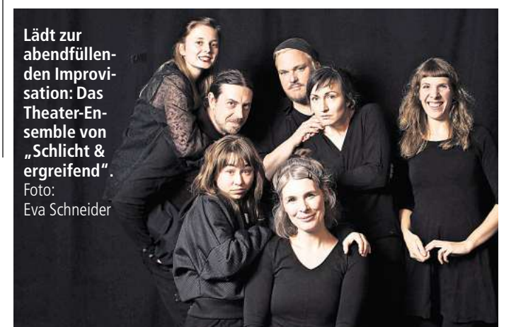
Lädt zur abendfüllenden Improvisation: Das Theater-Ensemble von „Schlicht & ergreifend“.

LEIPZIG. Abendfüllend improvisieren – geht das? Und ob: Davon wird das Improvisationstheater „Schlicht & ergreifend“ am Freitag, 19. Juni, im Dachtheater vom Haus Steinstraße mal wieder überzeugen.