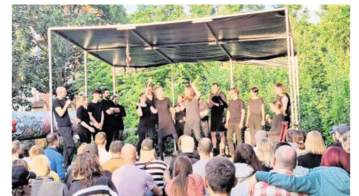
Bühne frei für den Impro-Nachwuchs: Dazu wird vom 16. bis 18. Juni in den Lene-Voigt-Park geladen.