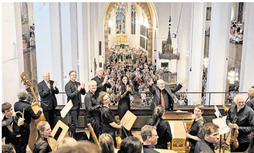
Das Bachfest – hier ein Bild vom Abschlusskonzert 2025 – ist in diesen Tagen wieder ein lebendiges Zeugnis von Leipzig als Stadt der Musik.

Und damit ein Teil im gleichnamigen internationalen UNESCO Creative Cities Network. Das Ziel ist klar, erklärt Kulturbürgermeisterin Dr. Skadi Jennicke: „Mit der Bewerbung als UNESCO City of Music wollen wir Leipzig international noch sichtbarer machen, von anderen Musikstädten des Netzwerkes lernen und das Profil der Stadt als weltoffene Musikmetropole weiter schärfen.“ Ins Feld führen kann Leipzig eine ganze Menge – auch daran ließ sie keinen Zweifel: „Leipzig lebt von seiner außergewöhnlich facet-