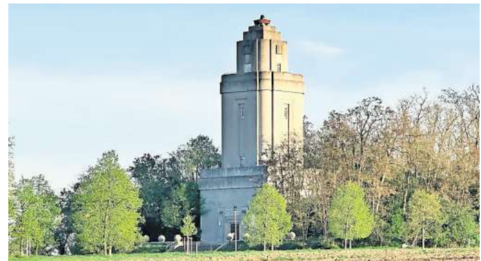
Zum Bismarckturm geht es am 24. Juni bei der Sommersonnenwendtour der Leipziger Wanderer.