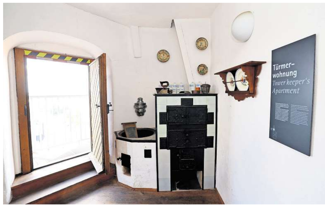
So sieht sie aktuell aus, Türmer-Wohnung in der Thomaskirche hoch über Leipzig.