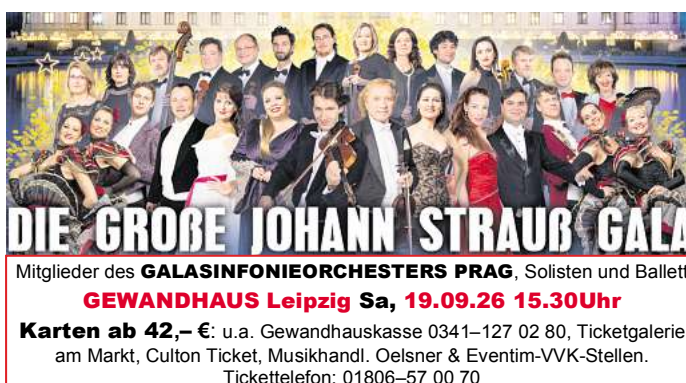
DIE GROBE JOHANN STRAUß GALA Mitglieder des GALASINFONIEORCHESTERS PRAG, Solisten und Ballett GEWANDHAUS Leipzig Sa, 19.09.26 15.30 Uhr Karten ab 42,- €; u.a. Gewandhauskasse 0341-127 02 80, Ticketgalerie am Markt, Culton Ticket, Musikhändl. Oelsner & Eventim-VVK-Stellen. Tickettelefon: 01806-57 00 70