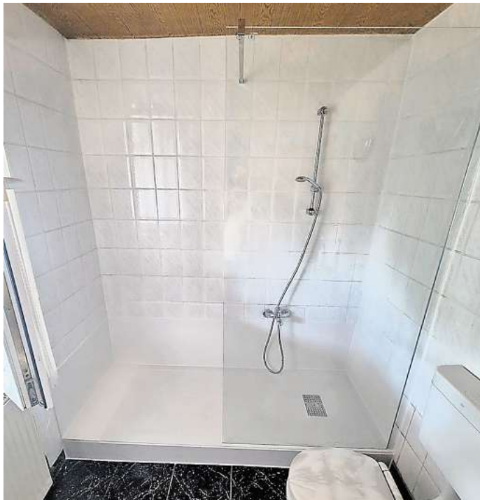
Die Profis von BADBARRIEREFREI benötigen für den Umbau zur Dusche einen Tag.

Im eigenen Bad werden herkömmliche Badewannen schnell zum Risiko. Wer darin badet oder sich im Sitzen abduckt, der kennt es: Der Ausstieg ist durch den hohen Rand oft rutschig und kein harmloses Vergnügen.