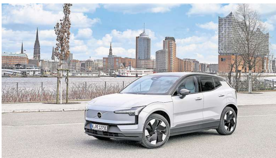
Volvo bietet Sicherheit - mit einer Garantie für Hochvoltbatterien in gebrauchten Elektrofahrzeugen.

Das Gebrauchtwagen-Programm „Volvo Selekt“ gibt Sicherheit – unabhängig vom Antrieb: Die zertifizierten Gebrauchten der schwedischen Premium-Automobilmarke erfüllen strenge Kriterien. Sie sind