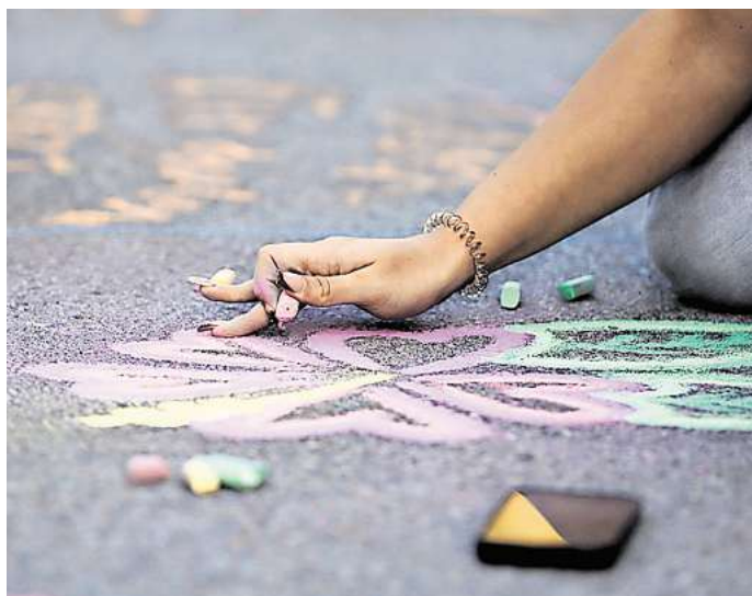
Mitmachen bei der im:puls Nacht: Bis 12. Juli kann man sich bewerben, um eine 500-Euro-Projekthilfe zu bekommen.

Dank der Unterstützung des Sächsischen Staatsministeriums für Soziales, Gesundheit und Gesellschaftlichen Zusammenhalt können dieses Jahr 30 Aktionen mit jeweils bis zu 500 Euro gefördert werden. Gesucht werden insbesondere Aktivitäten, die jugendliche Interessen im Bereich Kunst und Kultur widerspiegeln und eine aktive Mitgestaltung durch die Teilnehmenden ermöglichen. Beispiele für solche Aktionen sind DJ-Workshops, Dance- oder Skate-Battles, Song-Contests, Co-