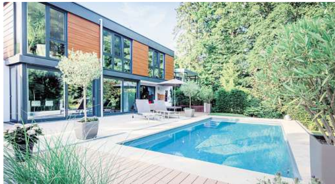
Familientreffpunkt, Fitnessstudio oder Urlaubsort – all dies kann der Pool im Garten sein.

Wie immer man sich entscheidet: ein eigener Pool bringt viele Vorteile. Er kann ein Ort sein, an dem Kinder abseits des Trubels öffentlicher Bäder schwimmen lernen und an dem die ganze Familie Zeit miteinander verbringt. Zudem steigert ein eigenes Schwimmbad den Wert des Hauses und das Wohlbefinden. Jetzt Schwimmbadbauer kontaktieren, um bald zu profitieren. Man findet die Fachbetriebe des Bundesverbandes Schwimmbad & Wellness unter www.bsw-web.de . AKZ