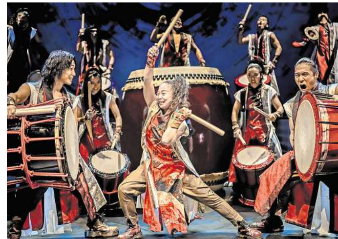
Zu Gast in der Oper Leipzig und zwar vom 30. Juni bis 5. Juli: YAMATO bringt die neue Show „Hito no Chikara – Die Macht der menschlichen Stärke“ auf die Bühne.

In einer Welt, in der die digitale Technologie immer mehr auf dem Vormarsch ist, vermittelt diese neue Show die unersetzliche Macht der menschlichen Stärke: Allein durch den Gleichklang der Trommeln auf der Bühne und durch das intensive Zusammenspiel mit dem Publikum entsteht ein unglaublicher kollektiver Energieschub, der Zuschauerinnen und Zuschauer sowie das Ensemble gleicherma-