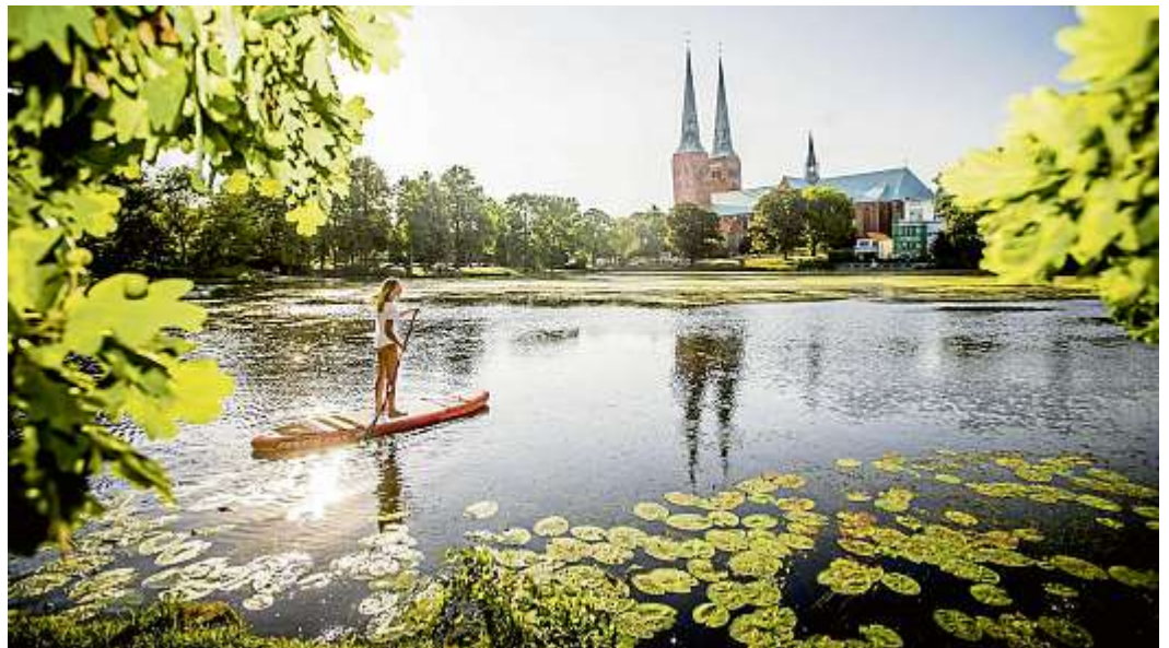
Das hanseatische Stadtleben lässt sich in Lübeck mit allen Sinnen genießen.

Die Hansestadt bietet ihren rund 219.645 Einwohnern und Besuchern gleichermaßen ein hohes