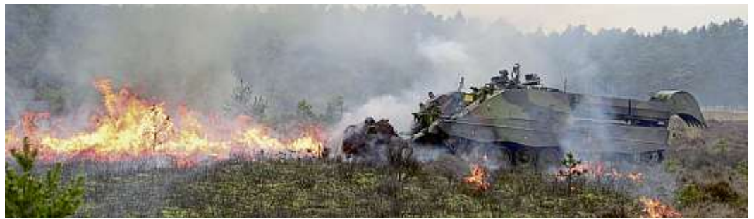
Pionierpanzer Kodiak im Katastrophenszenario.

Die Rheinmetall Landsysteme GmbH am Standort Kiel ist als wichtiger Teil eines bedeutenden Systemhauses zur Ausstattung der Bundeswehr und befreundeter Landstreitkräfte etabliert. Mit einem stetigen Aufwuchs auf nun 560 eigene hochqualifizierte Fachkräfte in Kiel ist der Standort ein innovatives Kompetenzzentrum für Fahrzeugentwicklungen und Prototypenbau – nicht nur für Gesamtsysteme, sondern auch für Rüstsätze, Software, elektronische Fahrzeugarchitekturen und autonomes Fahren. Über 400 Ingenieurinnen und In-