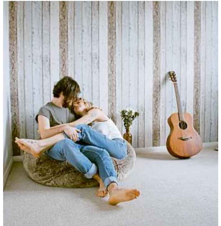
Die Lebenshaltungskosten sind von Stadt zu Stadt unterschiedlich. Vor einem Umzug empfiehlt es sich, eine Aufstellung zu machen.