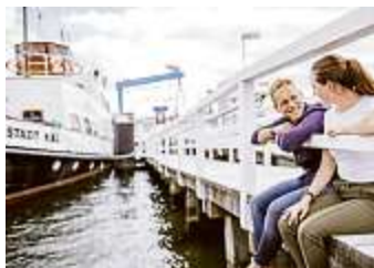
Seeluft schnuppern an der Förde.

Kiel gibt sich nicht mit kleinen Schiffen ab, sondern empfängt und verabschiedet täglich Ozeanriesen. Fähren von und nach Göteborg und Oslo sowie Kreuzfahrtschiffe steuern die Landeshauptstadt regelmäßig an, während Fördedampfer zum kleinen Preis hinüber ins Ostseebad Laboe fahren. Kurz: Wasser ist das Kieler Element. Das zeigt sich im expandierenden Hafen, dem Cruise Terminal Ostseekai oder der internationalen Meeresforschung, in der hochspezialisier-