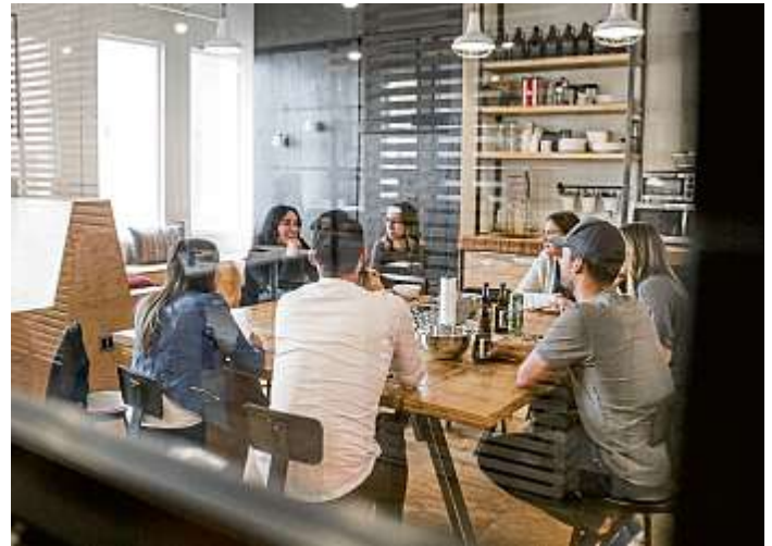
Nur wer sich an seinem Arbeitsplatz wohlfühlt, ist bereit, sich voll und ganz hinter das Unternehmen zu stellen.

Wer in seinem Büroalltag stundenlang vor dem Bildschirm am Schreibtisch sitzt, weiß mit Sicherheit um die schädlichen Faktoren Bewegungsmangel und falsche Haltung, die von Verspannungen