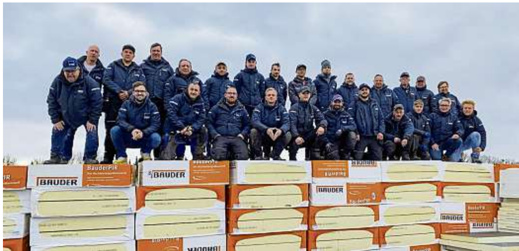
Ein starkes Team: die Mitarbeiter der Dachdeckerei Gerke.

Das Tätigkeitsfeld des Unternehmens umfasst das Dachdeckerhandwerk mit den dazugehörigen Bereichen der Zimmerer- und Klempnerarbeiten, als Schwerpunkt die Flachdachtechnik. Die Mitarbeiterschaft setzt sich zusammen aus vier technischen, zwei kaufmännischen und 22 gewerblichen Arbeitnehmern, allesamt mit langjähriger Zugehörigkeit. Hinzu zu zählen sind aktuell auch sechs Auszubildende. Die technische Ausstattung ist sehr umfangreich und neuwertig. Die