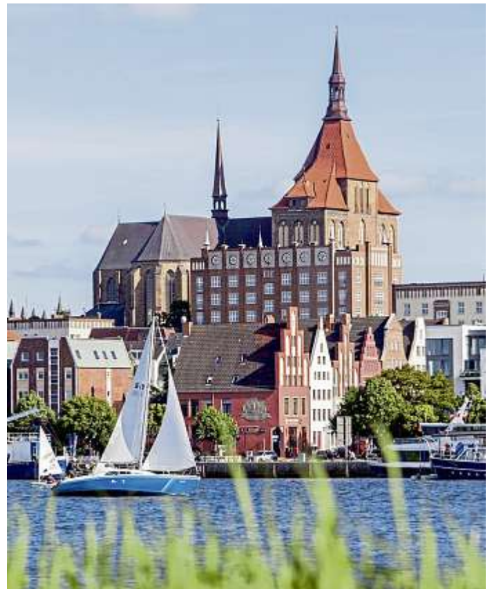
Die Hafenstadt Rostock bietet maritime Lebensqualität.