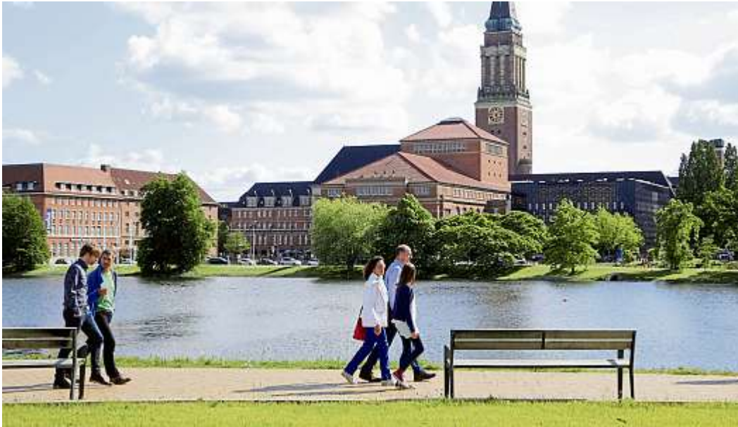
Die Stadt Kiel als Arbeitgeberin bietet einen sicheren Arbeitsplatz mit vielen Benefits.