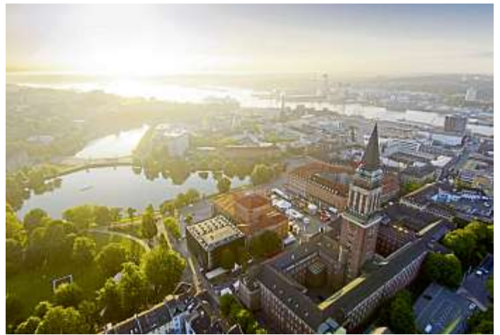
Entspannte Großstadt am Meer: Die unmittelbare Nähe zur Ostsee und das maritime Flair machen Kiel so lebenswert.

ten Marine oder dem Weltklasse-Wassersport. Eine Regatta im Jahr 1882 stand am Anfang, heute ist die Kieler Woche rund um den Globus bekannt als größtes Segelsportereignis der Welt und zudem noch größtes Sommerfest im Norden Europas und namhaftes Forum für politische Treffen. Fast 250.000 Einwohner und Einwohnerinnen hat Kiel, hier schlägt das Herz der Wirtschafts- und Kulturregion Schleswig-Holstein. Die Einheimischen und Gäste aus aller Welt genießen ein breites und vielseitiges Kulturangebot und ein geistiges Klima der Offenheit, Neugier und Produktivität. Kiel ist eine traditionsreiche Werft- und Marinestadt mit einer lebendigen Studentenszene, kinderfreundlichen Menschen und urbanem Charme. Die ansässigen Werften liefern den neuesten Stand der Schiffstechnik „made in Kiel“. Die Förde-