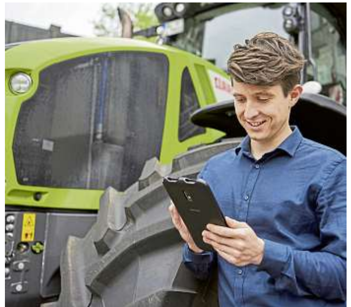
Die Firma TRASER ist der Softwarepartner für den Land- und Baumaschinenhandel.