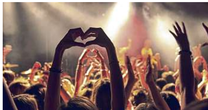
Lust auf Nightlife? In Lübeck, Rostock und Kiel gibt es Konzerte mit internationalen Stars in großen Hallen ebenso wie Auftritte von lokalen Künstlern in kleineren Clubs.

Wer sich die Mieten beziehungsweise die Preise für Immobilien oder Grundstücke in den Großstädten und den direkt angrenzenden „Speckgürteln“ anschaut, dürfte staunen. Denn die aufgerufenen Beträge sind vor allem für Berufseinsteiger kaum zu stemmen. Da lohnt sich ein Blick in die ländlicheren, mittelständischen Regionen, wo Bauplatz noch vorhanden ist, Mieten deutlicher güns-