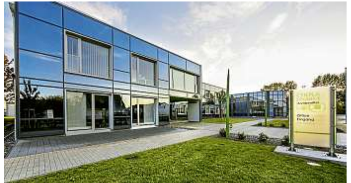
Arbeiten bei CHEPLAPHARM basiert auf Teamwork, gegenseitigem Vertrauen, Respekt und Expertise.

CHEPLAPHARM bietet ein attraktives Arbeitsklima in einem wertschätzenden und motivierenden Umfeld und einer optimal ausgestatteten Umgebung. Dies unterstützt unsere engagierten und zielorientierten Teams bei der täglichen Verfolgung unserer Unternehmensstrategie – der weiteren erfolgreichen Umsetzung unseres Geschäftsmodells. Unternehmerische