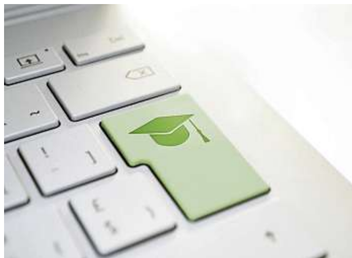
Einen umfassenden und anbieterneutralen Überblick über digitale Weiterbildungsangebote bietet das Kursportal Schleswig-Holstein.

Manchmal ist das Ziel auch erstmal eine Idee und der Weg dorthin noch nicht ganz klar. Wer Unterstützung dabei benötigt, sich in der Vielzahl der Weiterqualifizierungsmöglichkeiten und Förderinstrumente zurechtzufinden, kann das kostenlose Angebot des