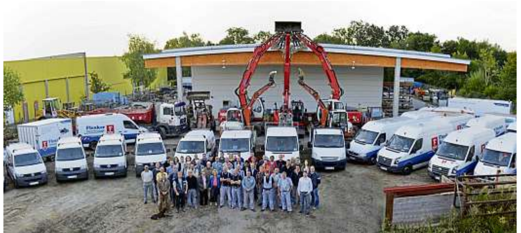
Die Firma Flenker Bau aus Schwentimental sucht laufend Verstärkung fürs Team.

Flenker Bau, das ist ein motiviertes Team von rund 50 Facharbeitern, die eine umfangreiche Palette von Tätigkeiten ausführen. Dazu gehören Altbausanierungen, Bauen im Bestand, Neubau von Ein- und Mehrfamilienhäusern, Industriebauten, Reparaturen